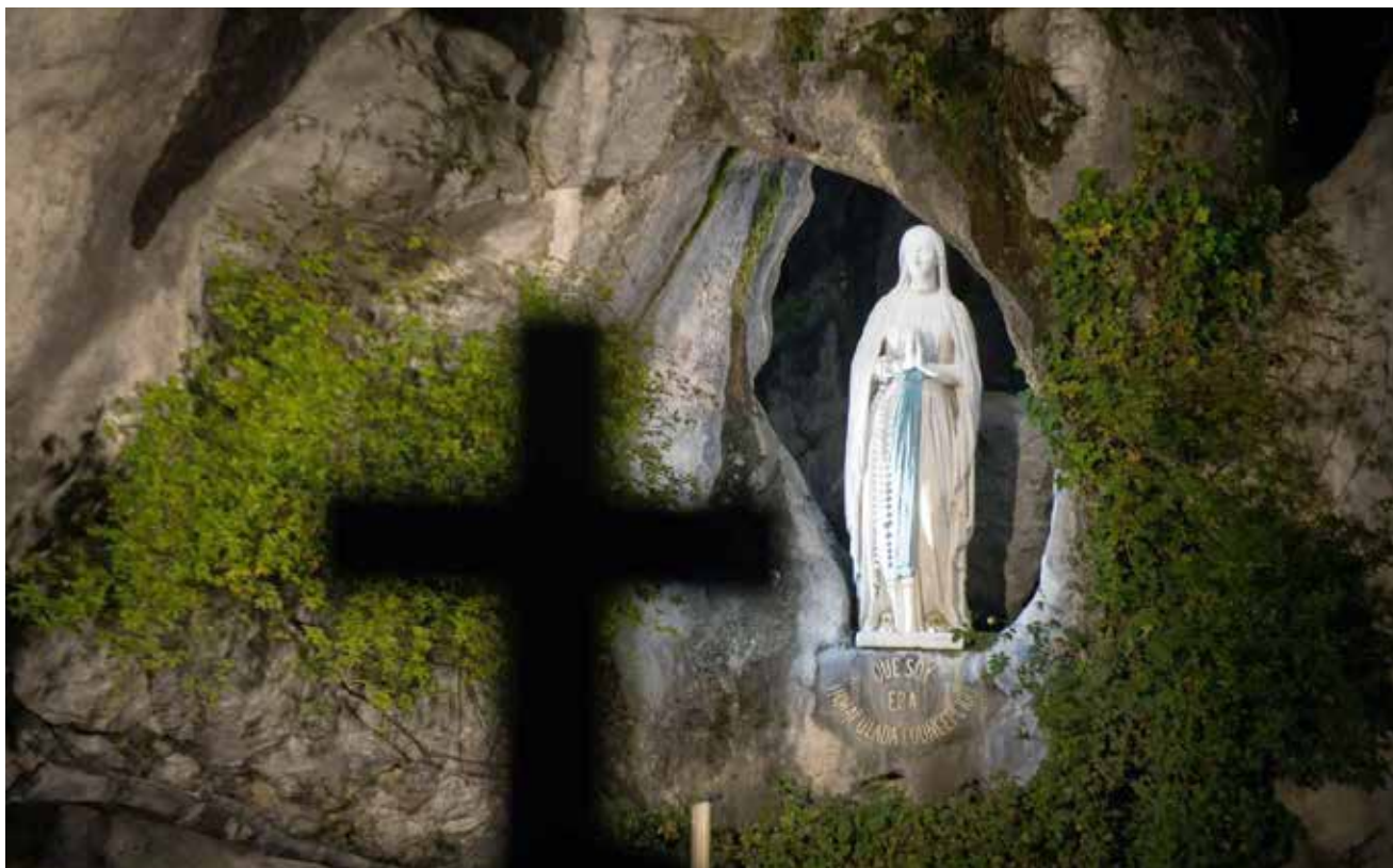
Grotta delle apparizioni della Madonna a Lourdes