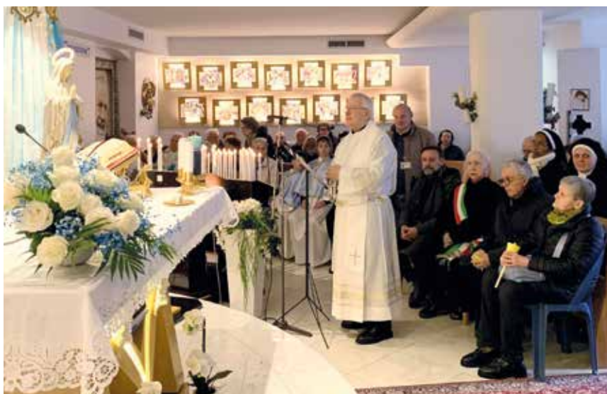
Monsignor Magni in preghiera davanti alla statua della Madonna di Lourdes

Alla fine della Messa, dopo la preghiera post-comunione, ascoltiamo la viva voce di Papa Francesco che all'Angelus delle ore 12 di questa domenica ha voluto salutare anche Radio Mater per questo suo trentesimo anniversario.