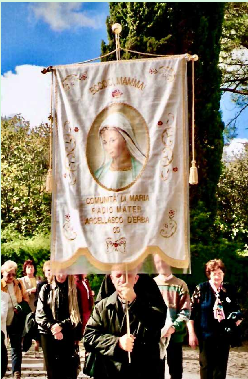
Don Mario nel Pellegrinaggio a Fatima anno 2001

Mamma, che custodisci nel Tuo cuore il mistero del nostro cam-