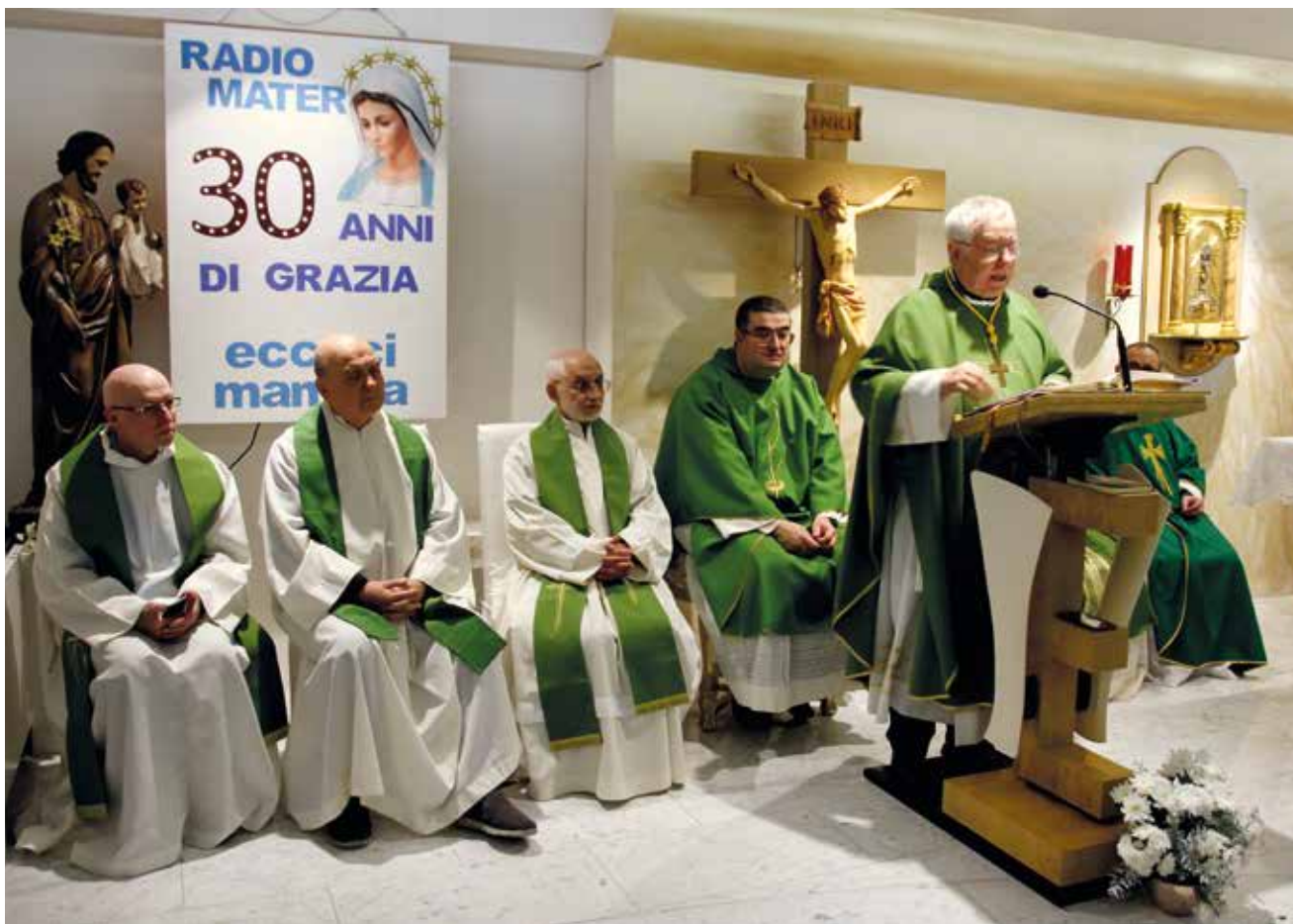
Omelia di Monsignor Magni durante la celebrazione

Poi la statua è uscita fuori per benedire anche i fedeli ivi radunati, fino alla Cappellina, per spargere su tutti grazie spirituali e materiali.