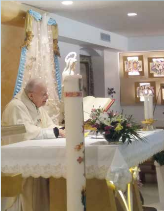
Don Mario durante una celebrazione pasquale

Sì, miei cari, è Pasqua: Gesù ha consegnato la Sua vita a noi, a te, a me, per rinnovare la nostra vita.