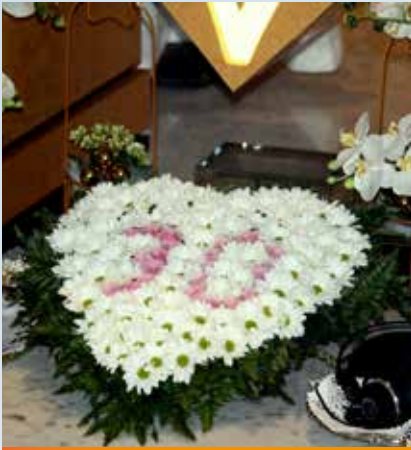
Cuore di fiori per i 30 anni di Radio Mater