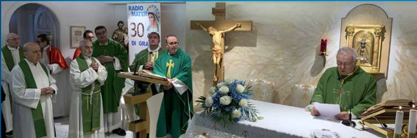
Lettura del messaggio di Sua Eccellenza Mons. Mario Delpini