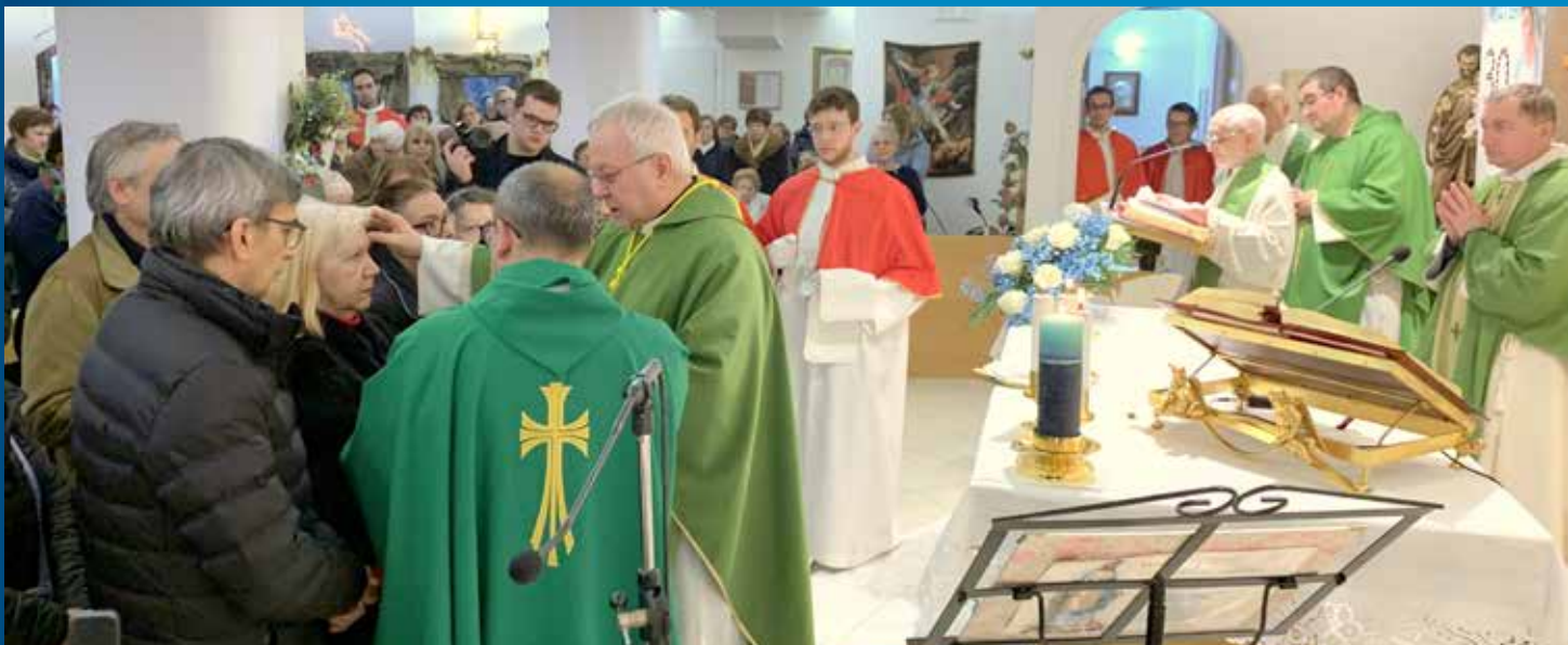
Unzione degli infermi