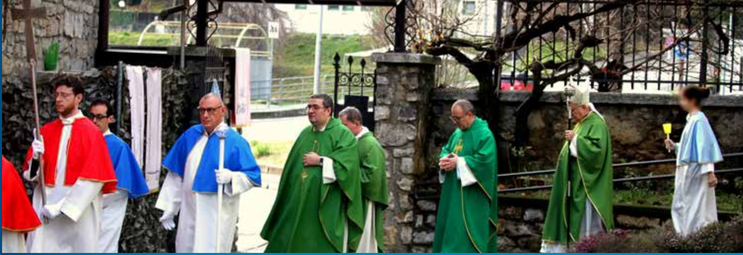
Processione all'interno della sede di Radio Mater