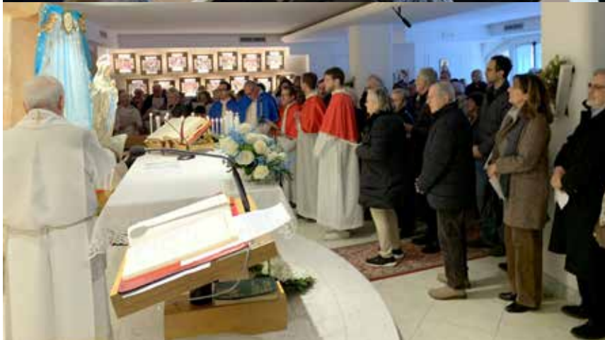
Conduuttori - Volontari davanti alla statua della Madonna di Lourdes all'interno della Cappella