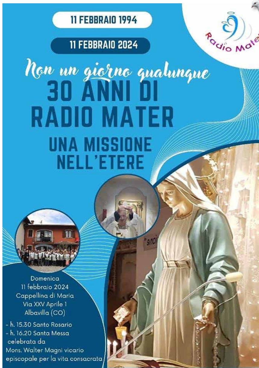
Locandina della celebrazione del 30°