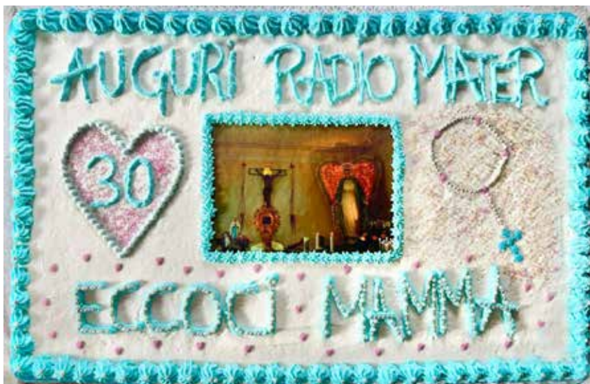
La torta dei 30 anni di Radio Mater

Spero non ce ne vogliate per questo che apparentemente po-